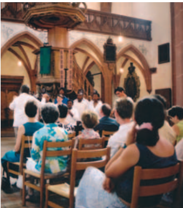
At the Church St. Leonhard, Basel.